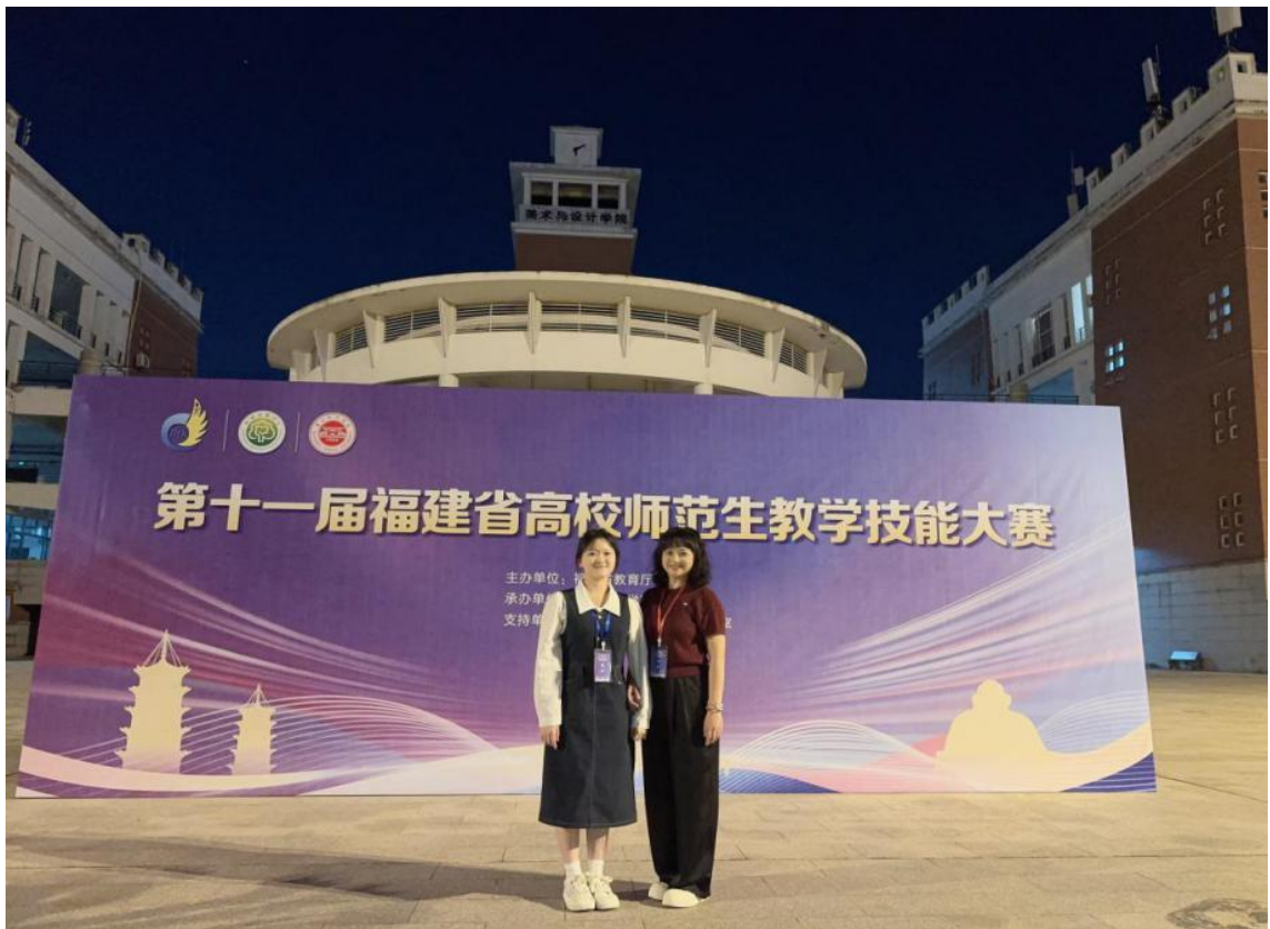
图 5：福建省高校师范生教学技能大赛荣获三等奖