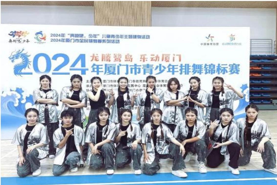
图 4：厦门市青少年排舞锦标赛获得 5 个一等奖

在 2024 年厦门市青少年排舞锦标赛的各个项目中获得 5 个一等奖。中华人民共和国第十二届全国少数民族传统体育运动会表演项目中获得 2 个三等奖。还参加 2024 全国和美乡村“村舞”交流展示活动。参加厦门市教育局的“桃李颂师恩”系列作品征集活动获得 3 个三等奖。