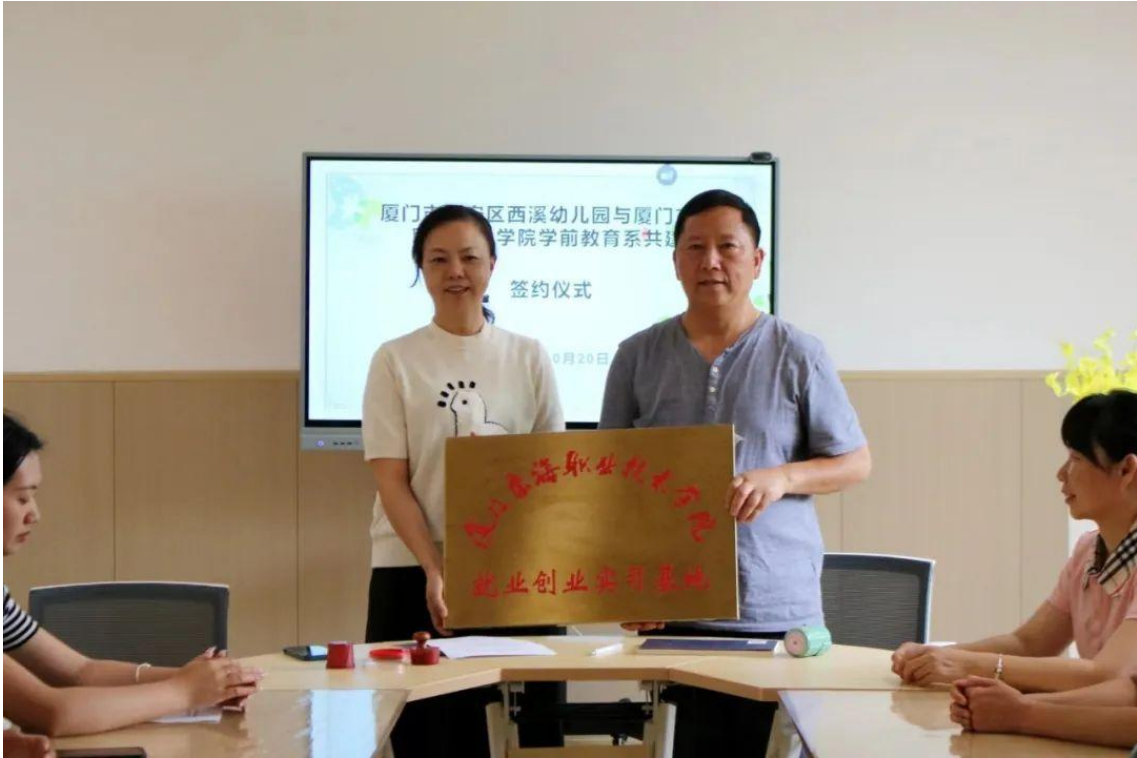
图 2：校企合作签约仪式及授牌

在 2024 年，我们与西溪幼儿园积极探索创新合作模式，共同致力于学前教育专业人才的培养。为学生提供了全真的教学环境，使学生能够在真实的幼儿园场景中进行教学实践。幼儿园还选派经验丰富的幼儿教师与我们教师共同组成“双师型”教师团队，共同承担教学任务，通过理论与实践相结合的教学方式，有效提高了人才培养的质量和针对性。双方还联合开展课程开发工作，依据学前教育行业的最新发展趋势和岗位需求，共同制定课程体系和教学内容，确保培养出来的人才能够紧密契合市场需求。